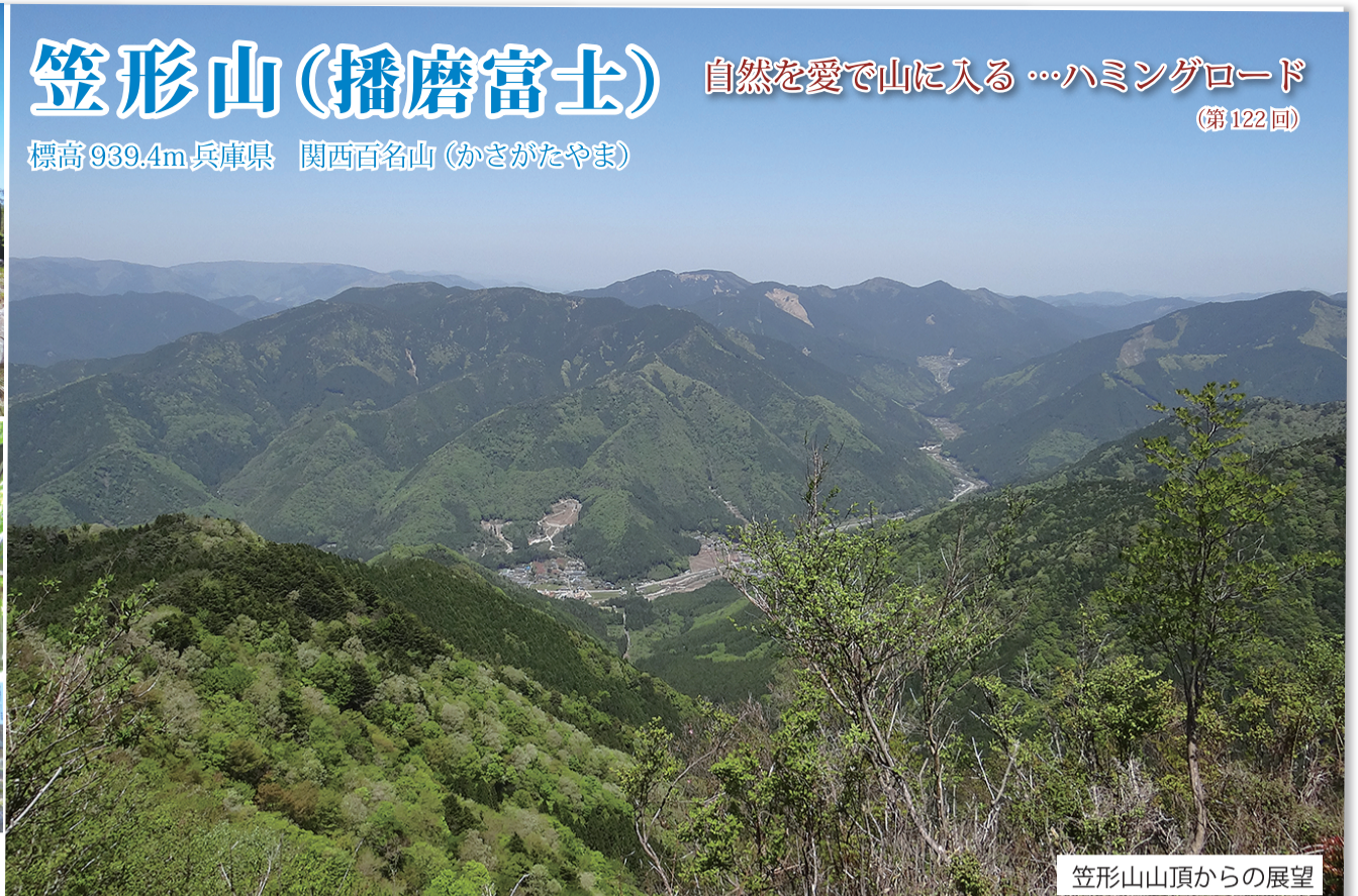
笠形山山頂からの展望

寺家駐車場 10:00~11:00 笠形神社~11:40 笠の丸~山頂 12:00~13:00 (昼食休憩) 山頂 13:00~13:20 笠の丸~14:00 ほうらい岩~14:20 仙人滝~14:50 寺家駐車場